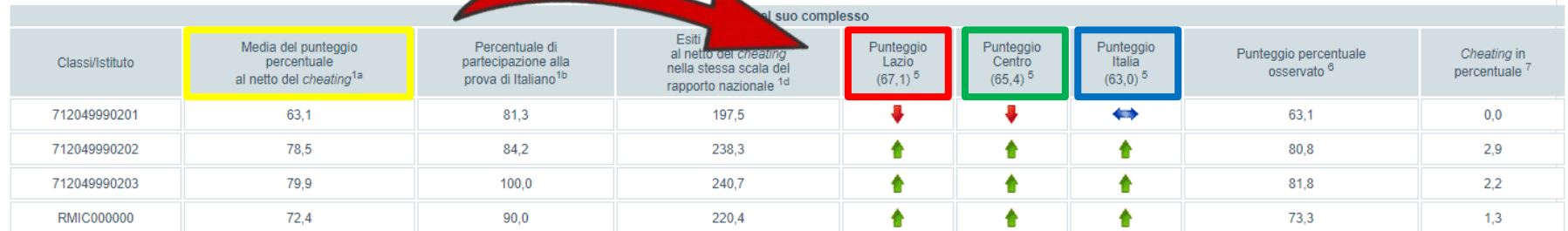
Tavola 1A Italiano

La percentuale di risposte corrette nelle prove da ogni classe/scuola (a video: colonna evidenziata in giallo) è messa a confronto con la percentuale di risposte corrette del campione statistico della regione di appartenenza (colonna evidenziata in rosso), del campione della macro-area geografica di riferimento (colonna evidenziata in verde) e del campione nazionale (colonna evidenziata in blu).